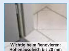
Wichtig beim Renovieren: Höhenausgleich bis 20 mm