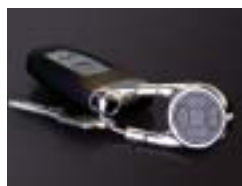
Design-Handsender HSD 2