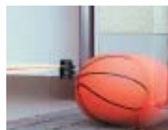
Lichtschranke EL 101