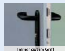
Immer gut im Griff