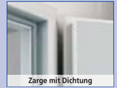
Zarge mit Dichtung