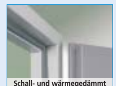
Schall- und wärmedämmt