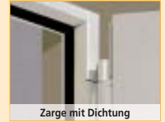
Zarge mit Dichtung