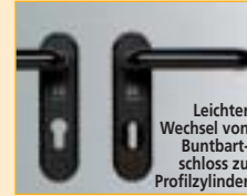
Leichter Wechsel von Buntbart-schloss zu Profilzylinder