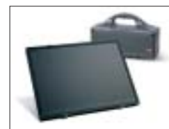
Solar-Modul für Akku