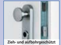
Zieh- und aufbohrgeschützt