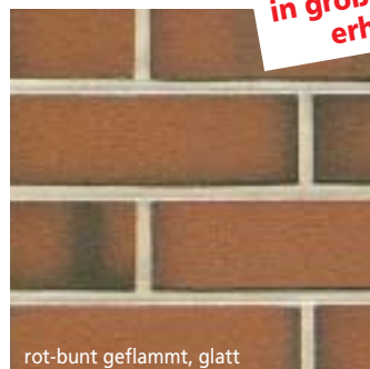
rot-bunt geflammt, glatt