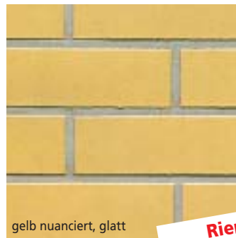
gelb nuanciert, glatt

Werden Winkelriemchen verwendet, gibt es optisch keinen Unterschied mehr zum herkömmlichen Mauerwerk.